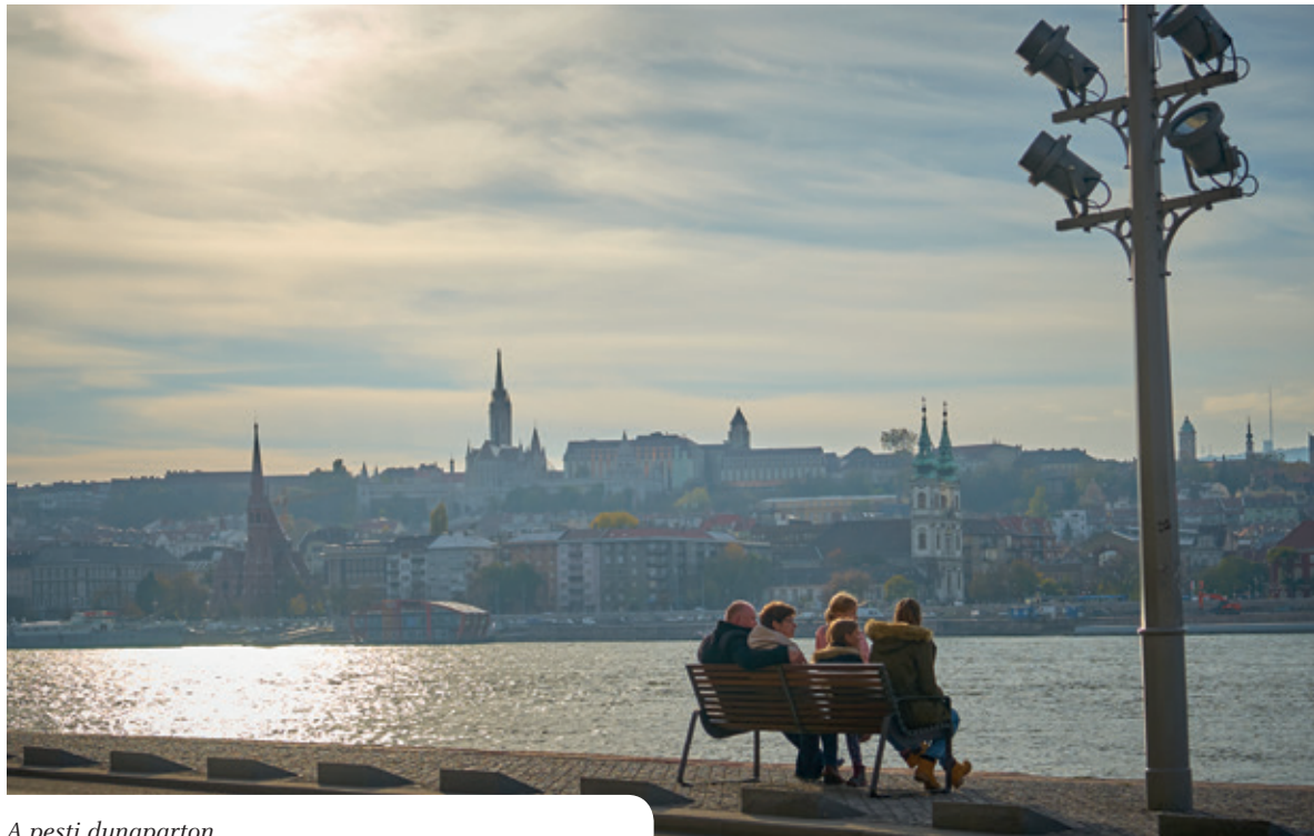
A pesti dunaparton

érvet mindenképpen el kell magunktól háritani, hogy globális méretekben a migráció képes megoldani az európai népességfogyást, mert ha ezt elfogadjuk, akkor nincs teendő. Ha azonban nem fogadjuk el, akkor van, és miután, ha Európát nem az európaiak fogják benépesíteni a jövőben, és mi ezt a tényt elfogadjuk, természetesen vesszük, akkor tulajdonképpen