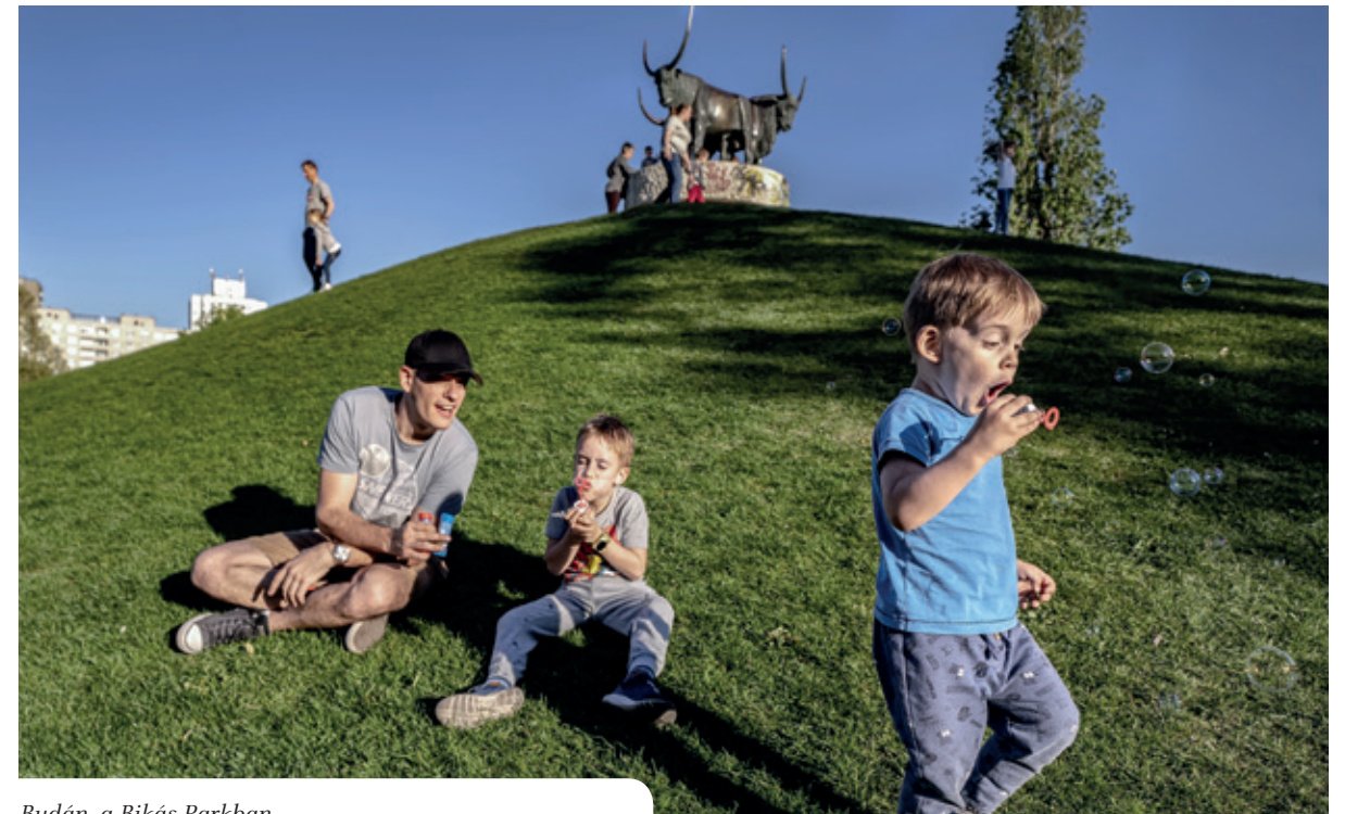
Budán, a Bikás Parkban

hogy hol van, kijelölhető-e egyáltalán az a pont, ahol azt mondhatjuk, hogyha a családtámogatási rendszer ezt elérte, akkor innentől kezdve biztosan – már amennyiben a politikában ez a szó értelmes –, majdnem biztosan eredményt is hoz majd, vagyis több gyermek fog születni. Amit most mondok, az magyarországi tapasztalat, szerintem európai érvényű, azon túl talán nincs érvénye, de Európában szerintem az az igazság, Magyarországon biztosan, hogy