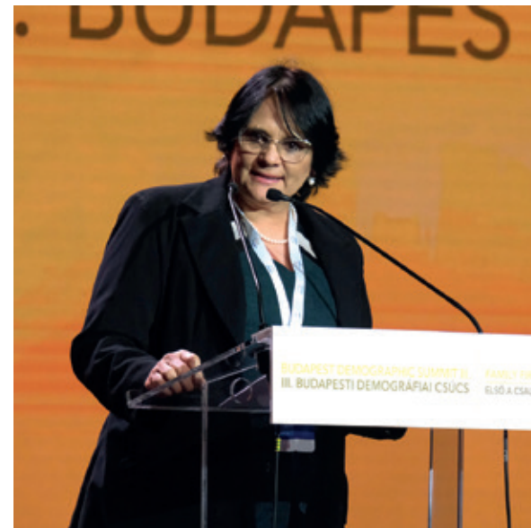
DAMARES REGINA ALVES

Bulgária családpolitikájáról elmondta: nagy összeget fordítottak családtámogatásra, a gyermeknevelésre, gyermekvédelemre és az adókedvezményekre. Ugyanígy az anyasági támogatásokra és adókedvezményekre is. Szerinte a családok szempontjából fontos, hogy az átlagbér is nőtt 9,4 százalékkal az utóbbi évben, amely az életszínvonal emelkedésével jár. Elmondta, hogy hazájában tovább javultak családalapítás feltételei. Oktatásügyi és egészségügyi reformra került sor, valamint a környezetvédelemre is jobban ügyelnek. Minden ilyen intézkedés kihat a demográfiai problémára is. Rávilágított, hogy a demográfiai politikában pozitív eredményeket ért el, miközben drasztikusan csökkent a gyerekhalálozás is.