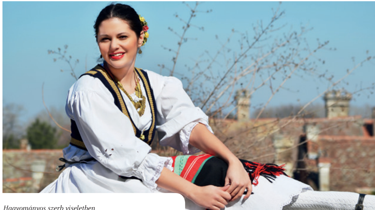
Hagyományos szerb viseletben

Valamennyi intézkedésünk, melyeket a közelmúltban ezügyben hoztunk az első eredményeket a legszegényebb és nem a leggazdagabb területeken mutatták. Belgrád szívében pedig a termékenységi ráta továbbra is messze a legalacsonyabb. Ez lenne tehát az ok, amelyet korábban a nagyrebecsült bíboros úr is említett? Önmegvalósítás lenne, vagy mondhatnám személyes önzés, vagy valami olyasmi, amit nagyon