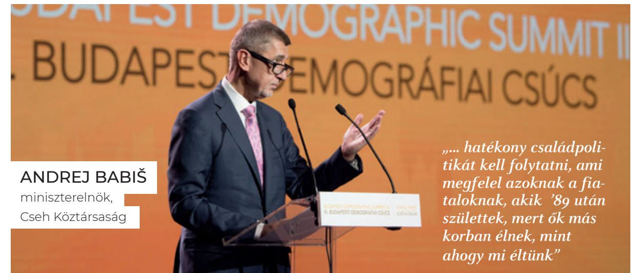
ANDREJ BABIŠ miniszterelnök, Cseh Köztársaság

(Aleksandar Vučić beszédének szerkesztett változata)